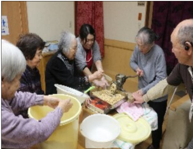
利用者、スタッフが共同で取り組むみそづくり

昔ながらの寒仕込みのみそづくりが1月23日、ひなの家押野であり、利用者やスタッフが総出で作業に取り組みました。