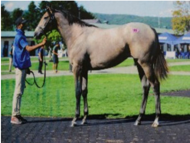
6月に初出走する「スパークル」

この馬は2018年5月に誕生したサラブレッド雌馬。父馬が「アジアエクスプレス」、母馬が「ヒカルヨザクラ」。北海道の牧場で生まれ、栃木県宇都宮市の牧場で調教中。3月上旬に金沢にやってきました。