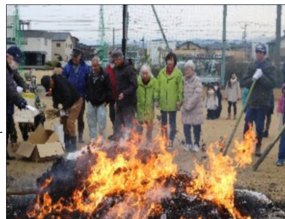
燃える炎に幸せ祈る