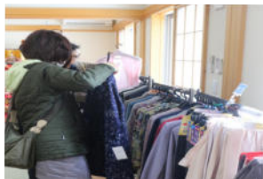
好みの商品を選ぶ女性

マーケットが実現しました。和室に設けた特設売り場には、婦人服、ブラウス、カーディガン、ズボン、セーター、肌着、靴下、靴などが所狭しと並べられました。初日は朝から雪が舞う肌寒い日でしたが、地域の人や利用者の皆さんが大勢詰めかけ、お目当ての商品を見つけて買っていかれました。出張マーケットは2日間で約50人が訪れました。訪れた住民の中には「わざわざ近江町まで会に行かなくても、家の近くで好みの婦人服が買えました」と大喜びでした。 今後、数カ月に一度、趣向を変えながら、「出張マーケット」を継続開催する予定です。