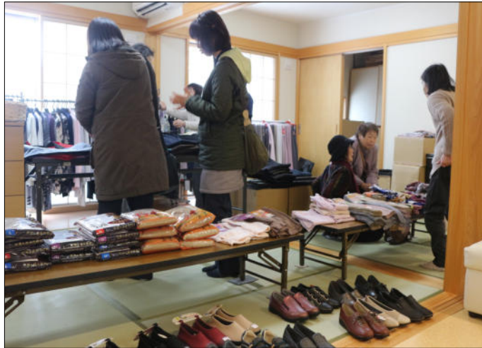
衣類や靴などが並ぶ出張マーケット

金沢市の近江町市場にあるオオミズスーパーが2月18、19日の2日間、野々市市のひなの家押野で「出張マーケット」を開きました。オオミズスーパーとひなの家押野のコラボした初めての試みです。