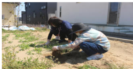
野菜植えに備え、草むしり

また、小屋のそばにある畑では、夏野菜を植えるために利用者の方や職員が草むしりに汗を流しました。広さ約300㎡には、一部にはジャガイモが植えてありますが、これからキュウリ、ナス、トマトなど夏野菜を植える予定です。収穫した野菜はホームの食事に利用します。