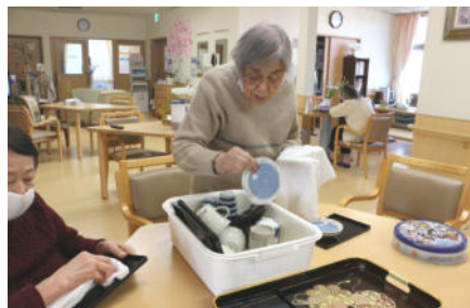
食器拭きにも励む