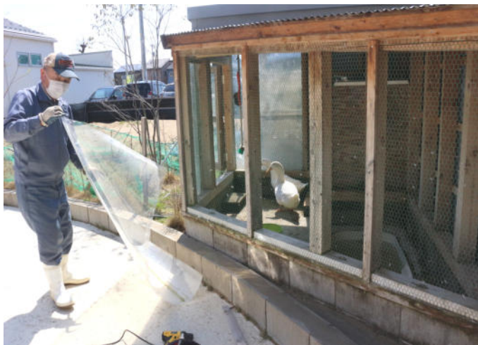
雪囲いが外されるアヒル小屋

好天に恵まれた4月9日、アヒル小屋の雪囲いが取り外されました。2羽のアヒルが暮らす小屋は、昨年11月にアクリル板を周り